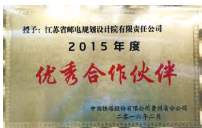
本集團獲鐵塔公司頒發優秀合作夥伴獎項