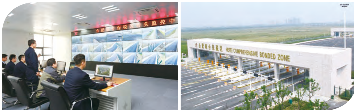
本集團承接海關信息化建設項目