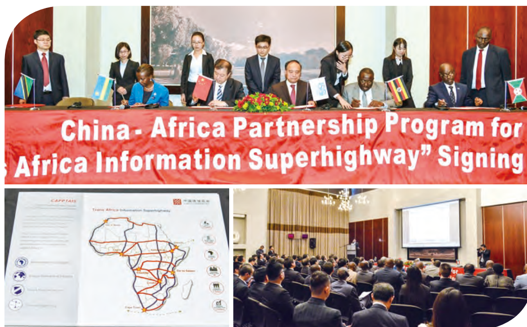
本集團在南非承辦「中非信息通信合作論壇」，策劃「中非共建非洲信息高速公路」項目，推動工信部、國際電信聯盟與東非共同體五國通信部簽署合作備忘錄

二零一五年，本集團積極調整海外市場布局和發展方式，優化業務結構，收入質量得到提升。同時，強化海外風險管控，利用應收賬款保理、外匯遠期鎖定等多種金融工具防範海外資金及匯率風險。本集團緊跟國家「一帶一路」戰略和「中非十大合作計劃」，在南非承辦「中非信息通信合作論壇」，促成中國工業和信息化部（「工信部」）、國際電信聯盟及東非共同體五國通信部共同簽署《共建東非信息通信基礎設施的合作諒解備忘錄》，積極策劃推動「中非共建非洲信息高速公路」項目，該項目已成為中國政府重點支持的對外合作項目，並納入工信部二零一六年重點推進項目。