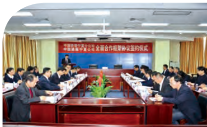
本集團與鐵塔公司簽訂合作協議