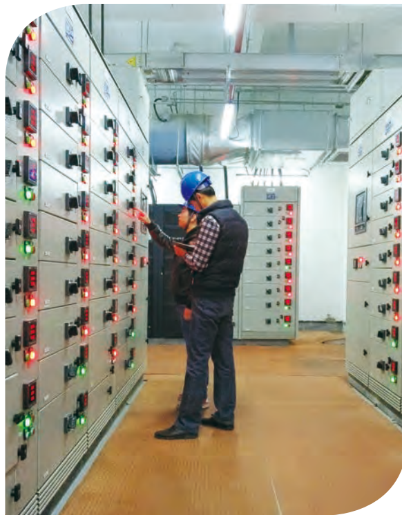
本集團承接數據中心項目

本集團是中國通信行業最大的業務流程外判服務綜合提供商。圍繞通信業務價值鏈，不斷延展業務範圍，提供主要包括信息技術基礎設施管理（「網絡維護」）、電信服務與產品分銷（「渠道」）、通用設施管理等服務。服務對象包括國內及海外電信運營商客戶、政府機構、企業等客戶。二零一五年，本集團著重發力國內電信運營商 OPEX 業務，加強 OPEX 業務的集約化運營和品牌建設，同時控制效益偏低業務的發展，業務流程外判服務收入達到人民幣 33,014 百萬元，同比增長 5.8%。