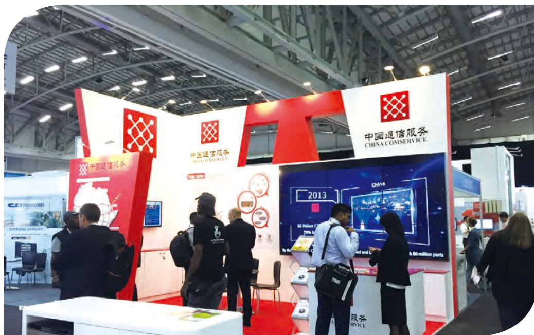
本集團參加海外通信業務展會

二零一五年，本集團堅持價值引領，繼續穩固在國內電信運營商市場的基本面，在緊抓國內電信運營商4G建設和寬帶光纖改造機遇的同時，聚焦國內電信運營商OPEX業務，同時加快拓展國內非運營商集團客戶市場、積極優化培育海外市場。二零一五年，本集團業績得到明顯提升，經營收入達到人民幣80,960百萬元，同比增長10.6%。