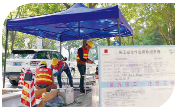
光纜網絡搶修工程

本集團向電信運營商提供光纜、電纜、基站、網絡設備和用戶終端等方面的網絡維護業務。維護業務的市場空間隨國內電信運營商網絡規模的擴大、維護外包業務量的持續增加和維護業務的新需求而不斷擴大。二零一五年，本集團積極承接國內電信運營商的現場綜合化維護業務，推進維護業務生產組織優化，不斷提高效率及效益。本集團網絡維護業務實現收入人民幣 9,756 百萬元，同比快速增長 19.8%，連續兩年均保持在 18% 以上的增長速度，為整體經營收入增量中第二大貢獻來源。