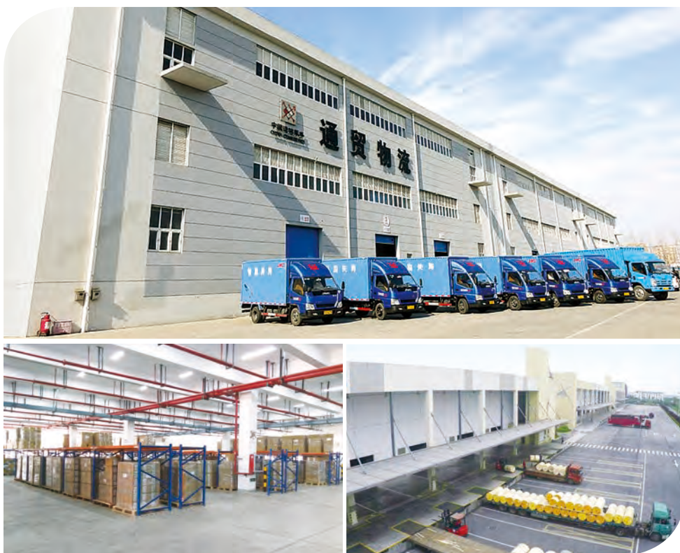
本集團的物流園區及車隊

本集團認為國內電信運營商OPEX業務空間廣闊，潛力巨大，國內非運營商集團客戶也有強勁的業務流程外判服務需求。業務流程外判服務具有客戶黏性強、應收賬款周轉天數低、現金流好等屬性，本集團將進一步集中資源，在重點業務領域開展專業化運營，實現規模化、效益化發展。