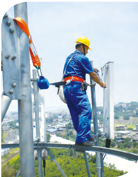
本集團承接4G建設工程