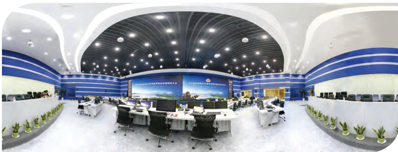
本集團承接智慧安防指揮中心應用平台項目

本集團將充分利用既有的產品與客戶基礎，通過體制、機制創新，激發專業公司和核心員工的活力與能力，加大在信息安全、物聯網、雲計算等關鍵領域的研發投入與對外合作，加快產品創新與推廣。本集團將進一步強化應用、內容及其他服務對電信基建服務、業務流程外判服務的帶動作用，推動公司技術進步和業務創新，助力公司可持續發展。