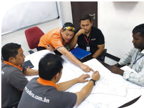
本集團為海外客戶提供通信網絡諮詢設計服務

本集團相信「網絡強國」、「寬帶中國」等所推動的通信基礎網絡建設，大數據、雲計算、互聯網+等所驅動的信息系統基礎設施建設，國家加速城鎮化和信息化所帶來的以「智慧城市」、「平安城市」等為代表的信息化業務，「一帶一路」所帶來的海外新機遇，以及鐵塔公司建設維護一體化服務需求都將為本集團在電信基建服務領域帶來新的增長空間。