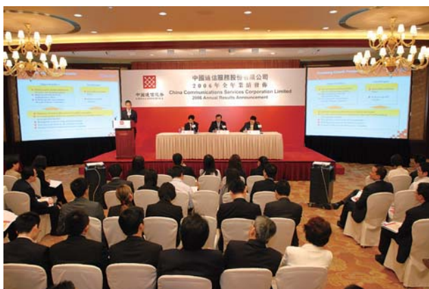
二零零六年全年業績發佈會

本公司重視與資本市場保持緊密聯繫。二零零七年，公司採用多種方式與投資者和分析師進行交流。其中，公司於香港共舉行了兩次業績發布會以及一次與收購有關的發布會，邀請媒體、投資者和分析師參加，並即場解答他們的提問。本公司更為上述的發布會安排於公司網站作網上錄像轉播，方便有關的信息能廣泛傳達。公司亦於香港及新加坡進行了共三次路演和參與了由國際主要投資銀行分別在北京和澳門舉辦的投資者大會。通過以上活動，以及日常與投資者和分析師的會面等雙向互動交流，一方面公司能向資本市場傳遞最新和最權威的公司信息，使他們更準確及全面瞭解公司的行業環境、公司發展策略，以及業務、財務及管理等多方面的工作情況，另一方面亦有助公司管理層掌握公眾對業務發展、戰略方針的意見，以改進公司的營運。