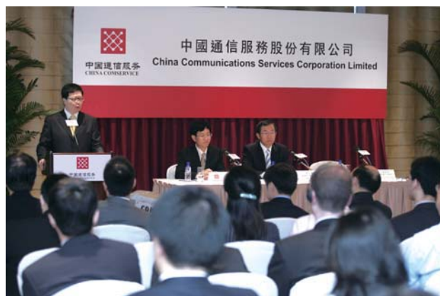
收購十三省目標業務分析員發佈會

於二零零七年，本公司分別被納入恒生中國國企指數和MSCI中國指數。此外，本公司的第一年年報一二零零六年年度報告，在具有國際權威性的《第二十一屆國際Mercury Awards》評選中，榮獲「年報一整體表現：電訊業類」銅獎。有關獎項是對公司在企業傳訊方面的出色表現，以及與資本市場積極溝通方面所付出努力的充分肯定。