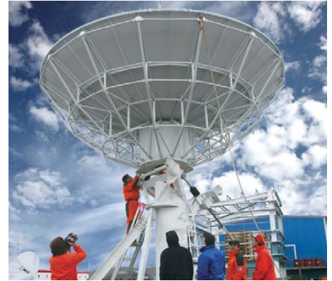
南極長城站衛星通信系統安裝工程