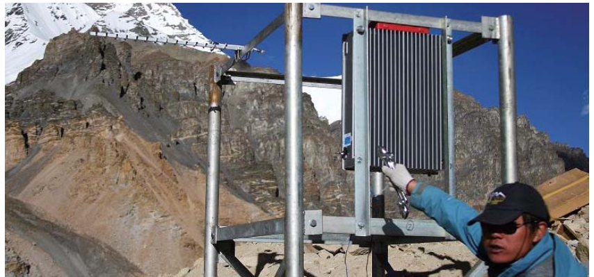
世界海拔最高的珠峰通信基站施工

化的綜合服務優勢，繼續從中受益。與此同時我們也意識到，全球金融危機帶來的經濟下行已經傳導到國內通信行業，將對我們電信基建服務的服務價格和利潤率水平構成壓力。