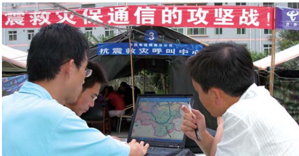
為汶川災區制定通信恢復規劃