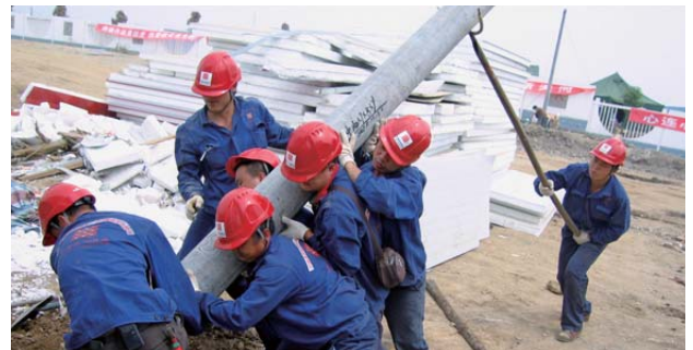
深入災區搶修通信設備