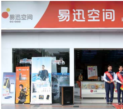
營銷門店 — 「易迅空間」