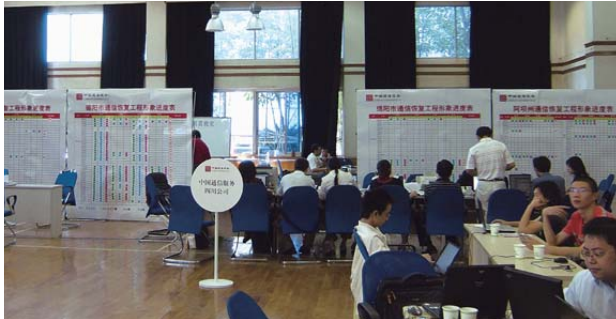
汶川地震救災指揮中心