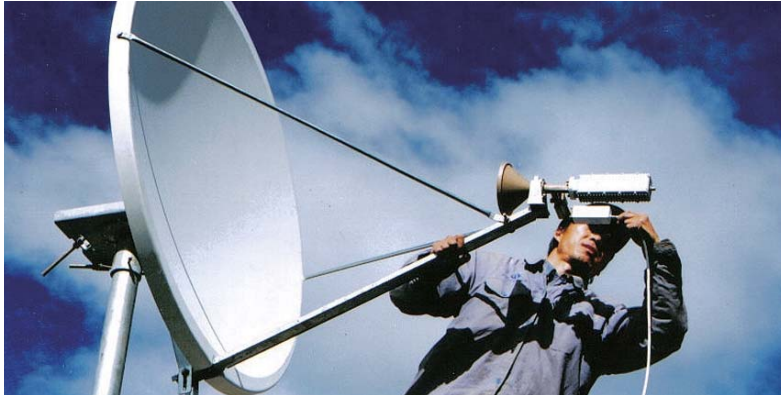
西藏農村電話衛星通信系統工程