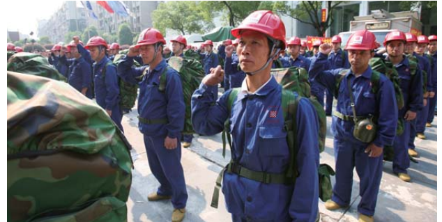
組織員工參與救災