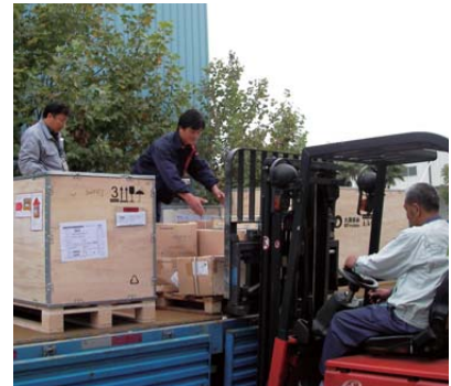
承接TD-SCMA設備的物流配送