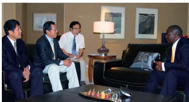
李平董事長與剛果（金）總統會面

2008年，我們繼續與通信運營商、設備製造商等緊密合作，共同開拓政企客戶市場。我們積極承接基礎設施、市政工程的配套通信設施建設，為政府機構、學校、醫院、企業（如國內大型石油公司及保險公司）的信息化建設提供包括廣域網、內聯網等在內的專業化解決方案和一體化服務。2008年本集團來自政企及其他客戶經營收入達到了人民幣10,775百萬元，較2007年增長了26.0%。