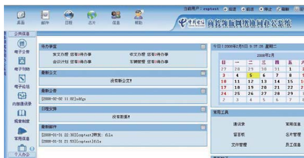
運營管理支撐系統(OSS, BSS, MSS)軟件開發