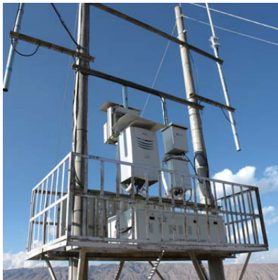
青藏高原的基站施工