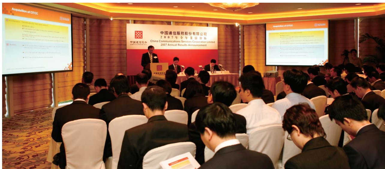
二零零七年全年業績分析師發佈會

二零零八年，本集團在亞洲領先的《亞洲財經》金融雜誌評選的亞洲最佳公司排名中，於中國地區的最佳公司管理及最佳企業管治方面，位列第五名。有關排名是資本市場對本集團努力成果的肯定。