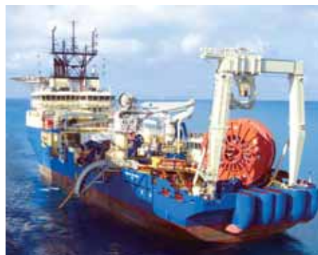
海底光纜施工設備

網絡和支撐系統的規劃、設計、施工及項目監理服務。二零一二年，本集團來自國內電信運營商的電信基建服務收入達到人民幣22,375百萬元，同比增長18.1%，市場領先地位穩固。