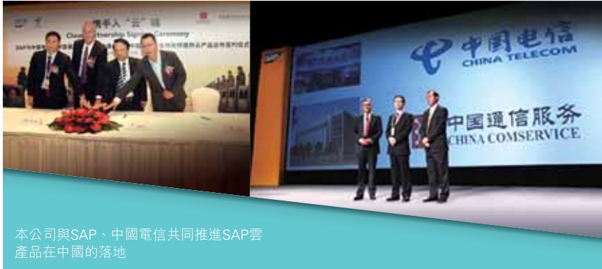
本公司與SAP、中國電信共同推進SAP雲產品在中國的落地