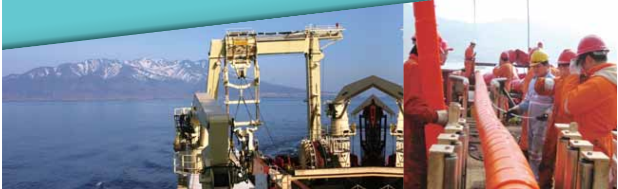
海外海底電纜工程

二零一三年，本集團繼續堅定實施「海外市場聚焦與四步走戰略」，聚焦總包項目拓展、實施運營管理外包，加強海外風險管控，海外收入總體佔比提升，海外業務結構優化。二零一三年，本集團重點拓展通信運營商、政府機構和大型企業客戶的總承包項目，如尼日爾項目、剛果(金)二期項目、文萊電信項目等，並取得了實質性突破。總承包收入佔海外市場收入比重達到42%，同比提升9個百分點。同時，本集團通過加強與中國電信的合作，共同實施剛果(金)運營管理外包項目，實質性邁進「四步走」戰略中的「第三步」。此外，本集團加強與商業銀行的合作，有效利用金融工具加快海外項目資金周轉，並採取為重點項目購買保險等方式積極管控海外風險。本集團的海外電信基建服務能力亦廣受