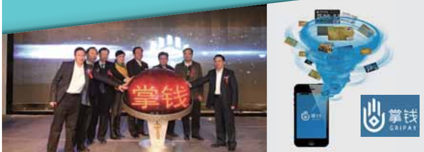
本公司發佈移動金融服務平台—掌錢

本集團將進一步深化開放合作與創新轉型，在知識、技術密集型專業公司發展混合所有制，試行項目經理責任制，建立資源、能力等協同共享機制，增強可持續發展動力和活力。