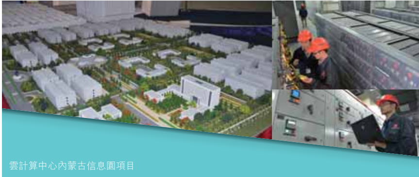
雲計算中心內蒙古信息園項目

了戰略合作協議，並成功與SAP在雲端運算方面開展合作。這不但豐富了本集團的產品和服務，亦提高了本集團的品牌知名度，推動了本集團在國內非運營商集團客戶市場的快速增長。