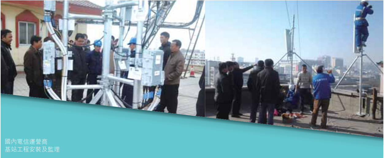
國內電信運營商 基站工程安裝及監理

二零一三年，本集團全力支撐國內三大電信運營商網絡建設的需求，來自國內電信運營商的電信基建服務收入達到人民幣24,903百萬元，同比增長11.3%，市場領先地位穩固。