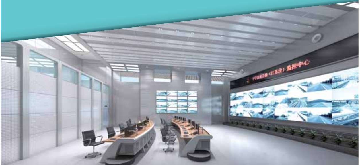
江蘇-滬寧高速公路 信息化工程

本集團亦面向政府機構、金融機構、廣電企業、建築企業等國內非運營商集團客戶以及海外客戶提供通信配套網絡綜合解決方案、信息化綜合解決方案、樓宇智能化解決方案。二零一三年，本集團政府客戶拓展成效明顯，智慧南京、平安新疆等重點項目成為業內標杆。行業客戶、中小企業客戶及海外客戶拓展亦穩步推進，並取得顯著成績。二零一三年，本集團來自國內非運營商集團客戶及海外客戶的電信基建服務收入為人民幣7,133百萬元，同比增長18.1%，有效支撐了本集團電信基建服務收入的增長。