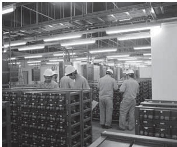
信息園區光纖寬帶網絡項目

本集團亦向政府機構、金融機構、廣電企業、建築企業等國內非運營商集團客戶提供通信配套網絡建設服務、信息化綜合解決方案、樓宇智能化解決方案。本集團在智慧城市、建築智能化、數據中心建設等方面亦不斷取得突破。