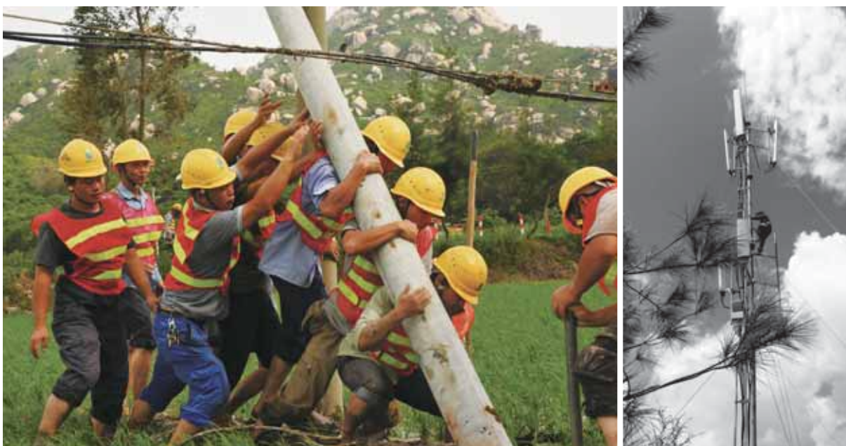
面對自然災害，搶險隊員努力搶修通信網絡