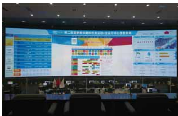
青奧會信息系統建設

二零一四年，本集團來自國內電信運營商客戶的收入實現人民幣47,117百萬元，同比增長8.8%，佔經營收入比重為64.4%。國內電信運營商是二零一四年經營業績貢獻第一的客戶。隨著LTE／第四代數字蜂窩移動通信業務(TD-LTE)的經營許可可在二零一三年十二月發放及LTE混合組網試驗城市數目自二零一四年六月開展並陸續增加，國內電信運營商逐步增加網絡建設投入，為本集團電信基建服務提供較大商機。同時，本集團緊盯國內電信運營商客戶持續增加網絡維護外包的需求，發揮工程與維護一體化服務優勢，全力支撐國內電信運營商客戶4G網絡建設和整體網絡維護。本集團認為，FDD LTE牌照發放將帶來國內電信運營商集中釋放的網絡建設投資，全面深化改革、「寬帶國家」戰略推進、鐵塔公司投入運作，亦將為本集團拓展國內該等市場帶來更多寶貴機遇。