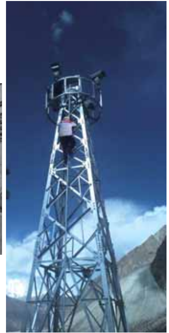
4G設備安裝與基站建設