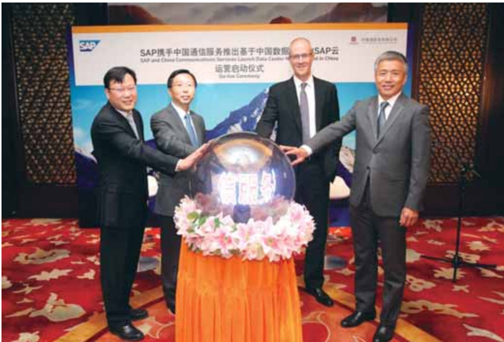
與SAP合作推出雲服務

本集團相信，以上該等領域市場空間廣闊。本集團將充分利用既有的產品與客戶基礎，通過體制、機制創新激發專業公司和核心員工活力和能力，加大在信息安全、物聯網、雲計算等關鍵領域的研發投入與對外合作力度，加快產品創新和進一步推廣。