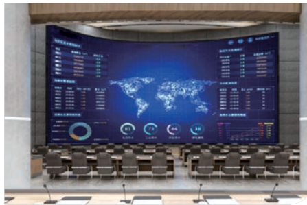
江蘇某地大數據中心EPC總承包項目