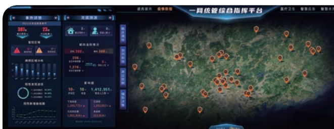
「一網統管」城市運行管理中樞