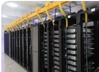
數字政府大數據專屬雲機房項目