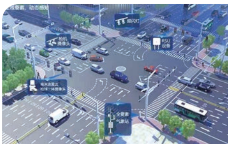
雄安新區容東片區數字道路智能化項目