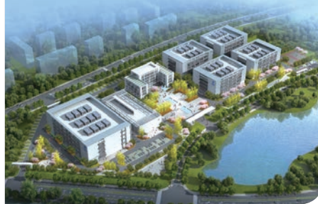
中國電信(國家)數字青海綠色大數據中心項目