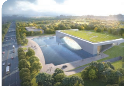
雄安城市計算(超算雲)中心項目