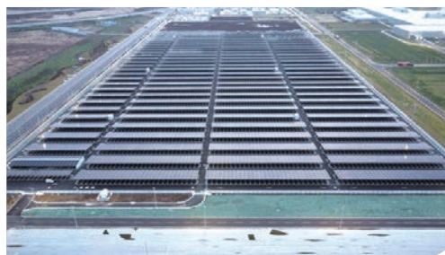
某工廠分布式光伏發電EPC總承包項目

本集團充分發揮自身「顧問+僱員+管家」服務優勢和「平台+軟件+服務」能力優勢，構建「行業+區域」營銷體系，在全國建立了完善的屬地化營銷體系，圍繞重點行業配置營銷人員1萬7千餘人，持續加大集團級產品協同營銷力度，年內新簽約人民幣千萬元以上合同1千2百餘個。圍繞核心產品加快技術專家團隊建設，目前已擁有1萬多名諮詢專家及軟件相關人才，通過持續培訓和雲展廳等信息化手段強化聚能、賦能，不斷建強專業人才隊伍。當前，本集團在政府、建築與房地產、互聯網與IT科技、交通、電力、金融、水利、教育、醫療等多個行業年合同規模均超人民幣十億元。